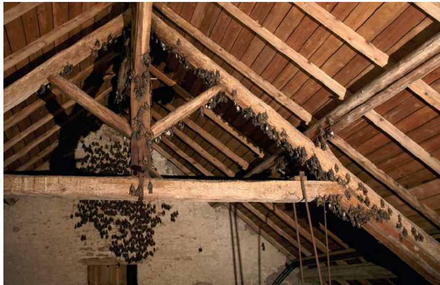
Gîte estival de reproduction dans une ancienne grange