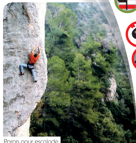
Parois pour escalade

Consultation de la carte des risques incendie : http://www.var-adm.net/massifs83_web/massifs83.gif