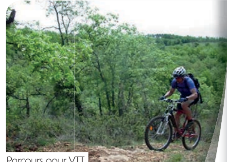
Parcours pour VTT