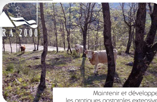
Maintenir et développer les pratiques pastorales extensives