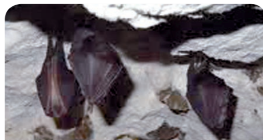
Aménagements en faveur des chiroptères