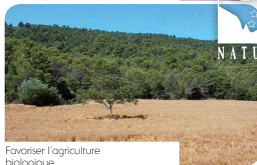
Favoriser l'agriculture biologique