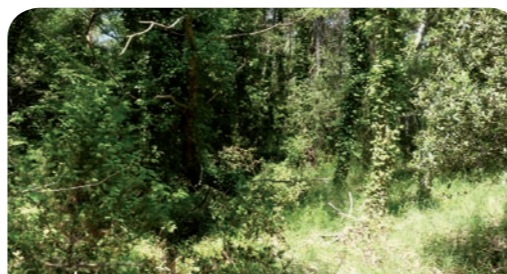
Travaux de débroussaillage et de restauration des milieux ouverts