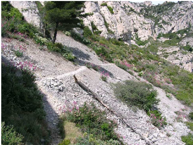
Éboulis calcaire dans les calanques, habitat de la Sabline de Provence