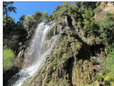
Grande cascade de tuf (parc de Villecroze)