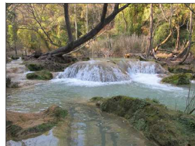
Berges humides de la Bresque et cascadelles de travertins (Sillans)