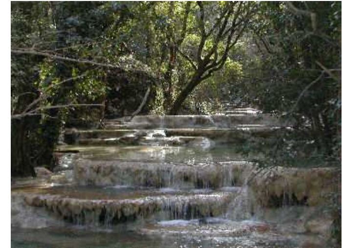
Travertins sur l'Huveaune, Ste Baume