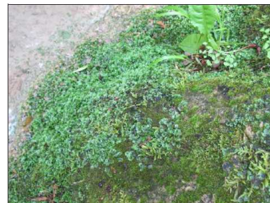
Berges humides de la Cassole tapissées de mousses et d'hépatiques à thalle (Cotignac)