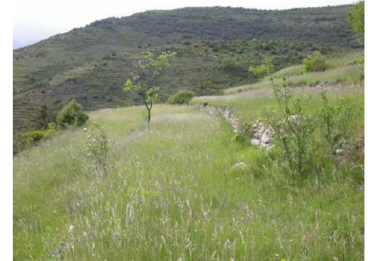
Pelouses sèches sur anciennes terrasses

Cet habitat est assez fréquent dans les sites Natura 2000, des Alpes à la Provence, mais souvent en faibles surfaces.