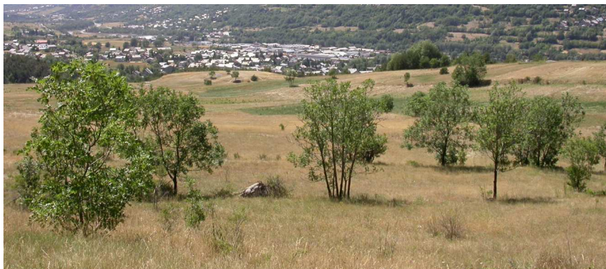
Pelouses sèches à proximité de Briançon