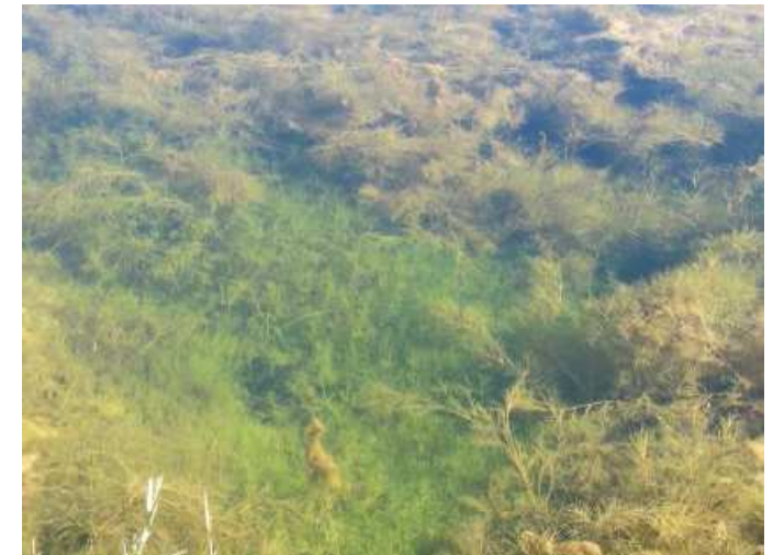
Herbier de Characées dans une zone humide eutrophe à Potamot pectiné